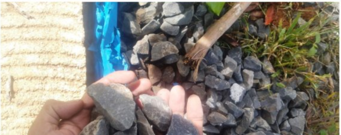
Rabat beton pekon batu kabayan

Lampung Barat - Pelaksanaan pembangunan jalan rabat beton dengan ukuran panjang 53,3 meter lebar 2 meter dan tebal 15 cm yang berlokasi dipekon batu kabayan kec. batu tulis kabupaten lampung barat yang bersumber dari dana